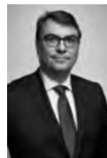
M. LE BÂTONNIER FRÉDÉRIC SICARD

67 boulevard Maiesherbes 75008 PARIS T. 01 47 23 47 24 F. 01 47 23 90 53 posur@ftms-a.com